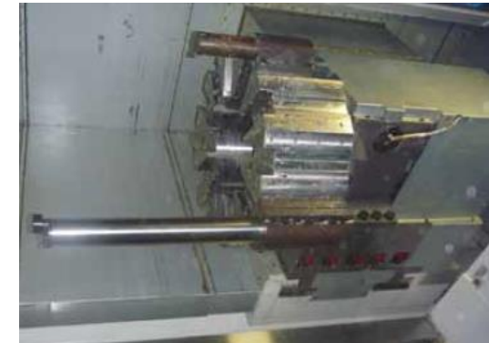
Vyvrtávání do hloubky 1000 mm