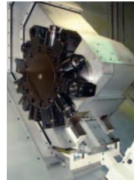
C osa a poháněné nástroje ( opce)