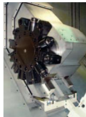
C+Y osa ( opce)